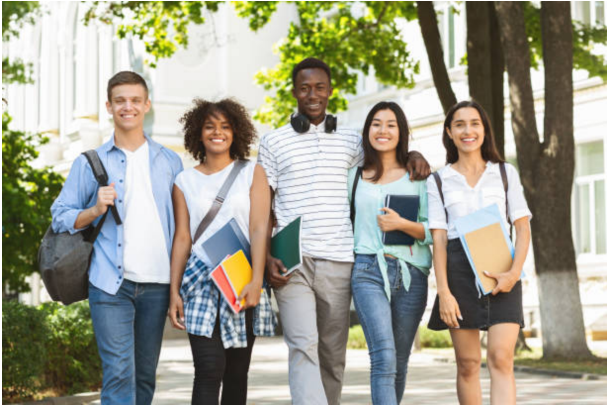
Jornadas de puertas abiertas