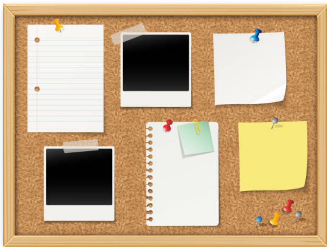
Tablón de anuncios